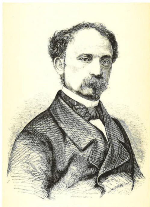
COUNT LEONETTO CIPRIANI, 1859